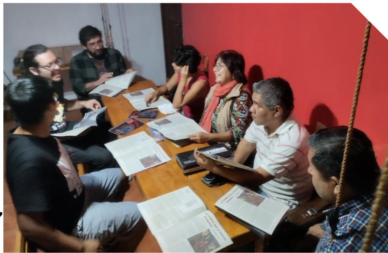
2ª sesión en Café Roka

En la segunda sesión, en Café Roka, se leyeron pequeños artículos que analizan cómo esas deudas nos impactan en la realidad. Y se explicó el anatocismo, esto es, el interés sobre interés o “interés compuesto”, el cual llega a sumar más que todo el dinero existente (ver p. 5). ▴