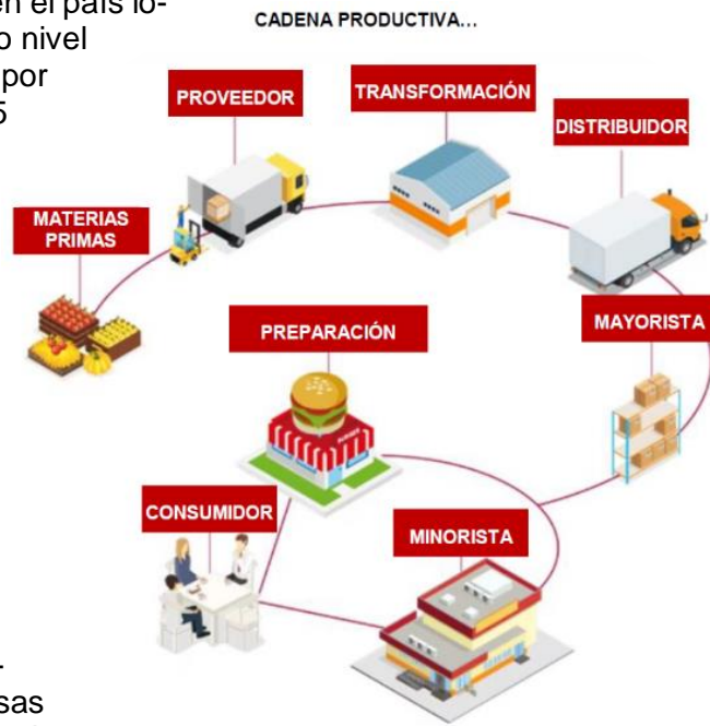
...toda, en manos de los banqueros.

Banorte fue la institución que más intereses obtuvo en 2023, con 300 mil 547 millones de pesos. Le sigue BBVA, y después Citibanamex. ▀