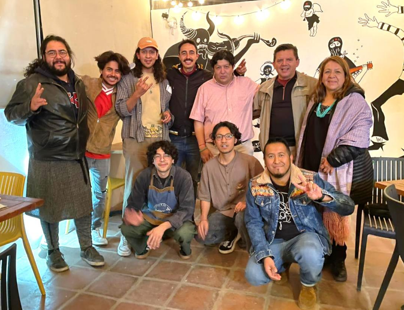
Túmin-Tolteca inicia el año con charla en Pachuca