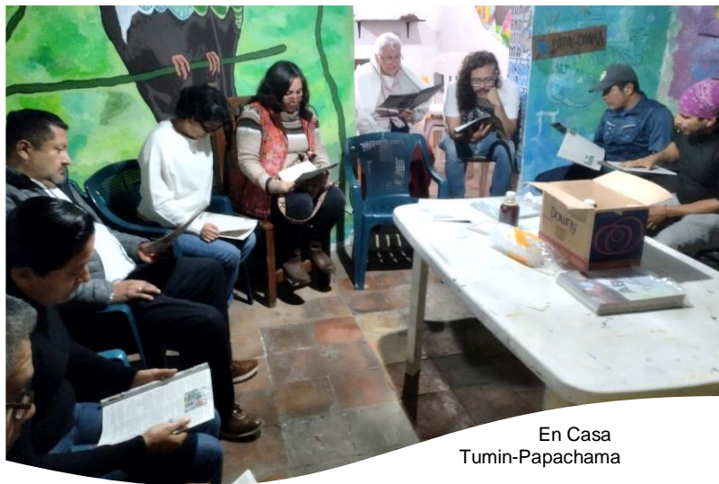
En Casa Tumin-Papachama

El jueves 18 de enero inició el Tercer Círculo de lectura del Túmin en Casa Túmin de Papachama, en Papantla, Ver. En los primeros 2 ciclos se leyeron los dos libros que se han editado sobre el Túmin, y en este tercer ciclo se leerán los folletos “ Los Dueños del Mundo ” y el “ ABC del Túmin ”.